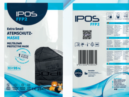
EAN Einzel Verpackt Extra Small