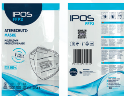
EAN Einzel Verpackt